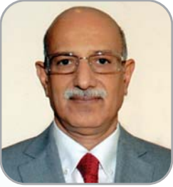
लोकमान्य गोल्छा संचालक