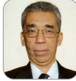
पद्म ज्योति संचालक