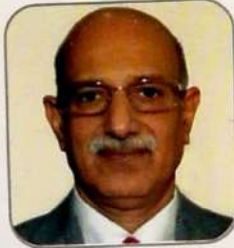
लोकमान्य गोल्छा संचालक