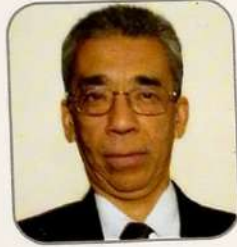
पद्म ज्योति संचालक