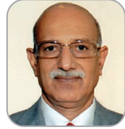
लोकमान्य गोल्हा संचालक