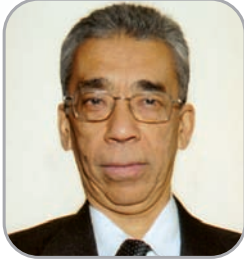
पद्म ज्योति संचालक