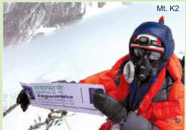
Sagarmatha Insurance reaching heights