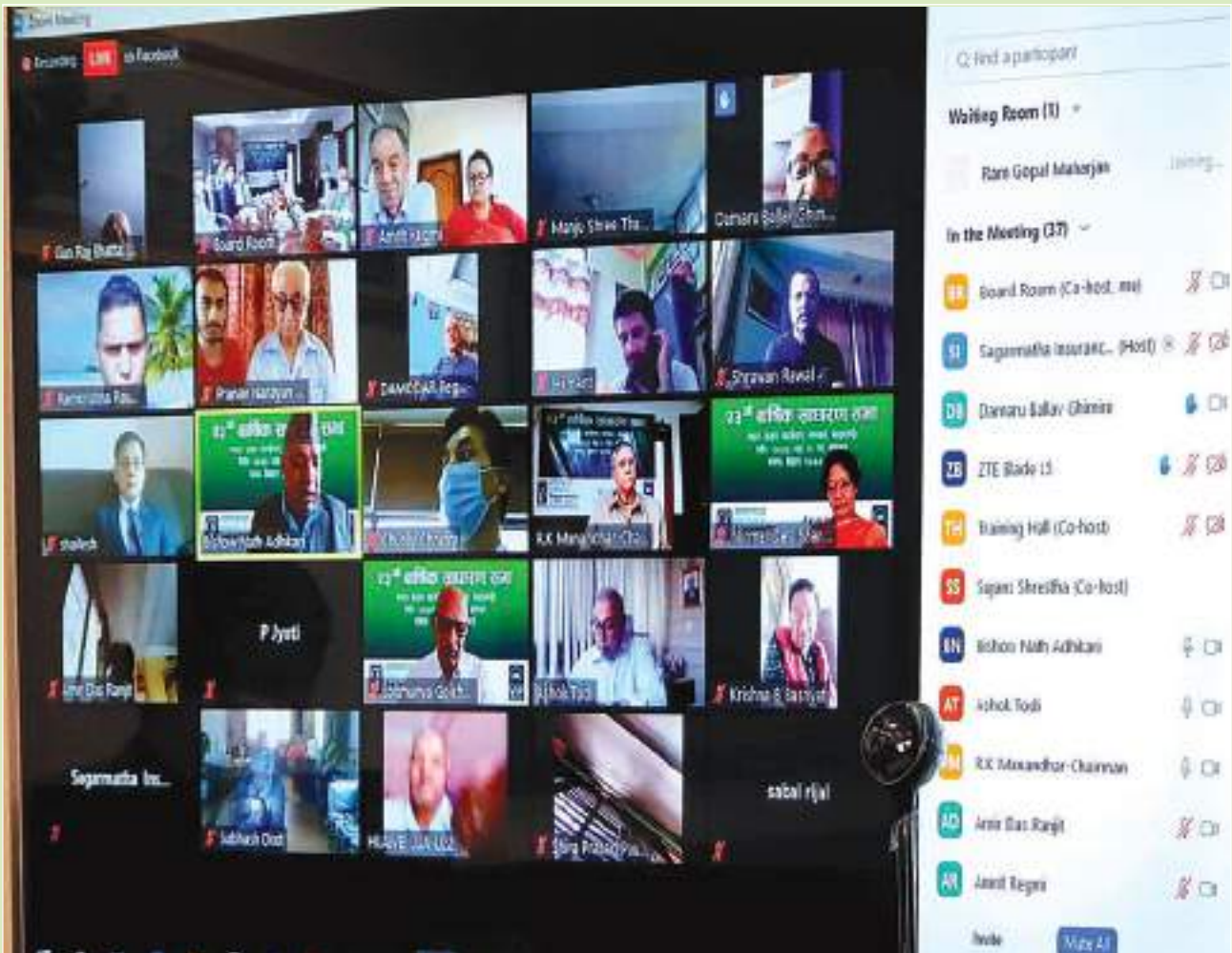
Participants of 23rd AGM via ZOOM