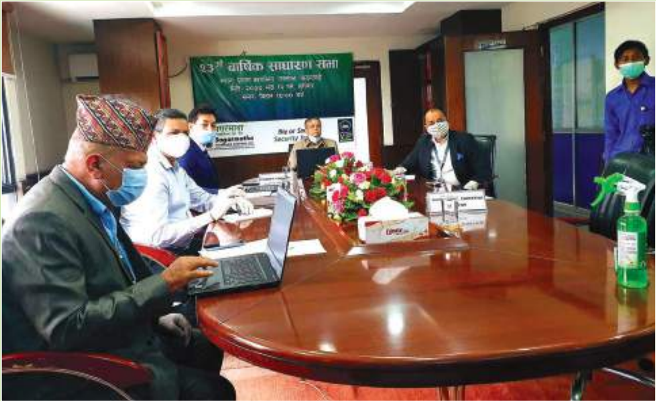
23rd AGM - Bhadra 13, 2077