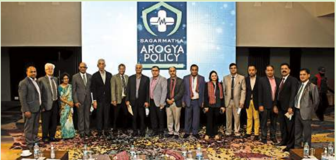
Arogya Policy Launch Event, Chaitra 31, 2077