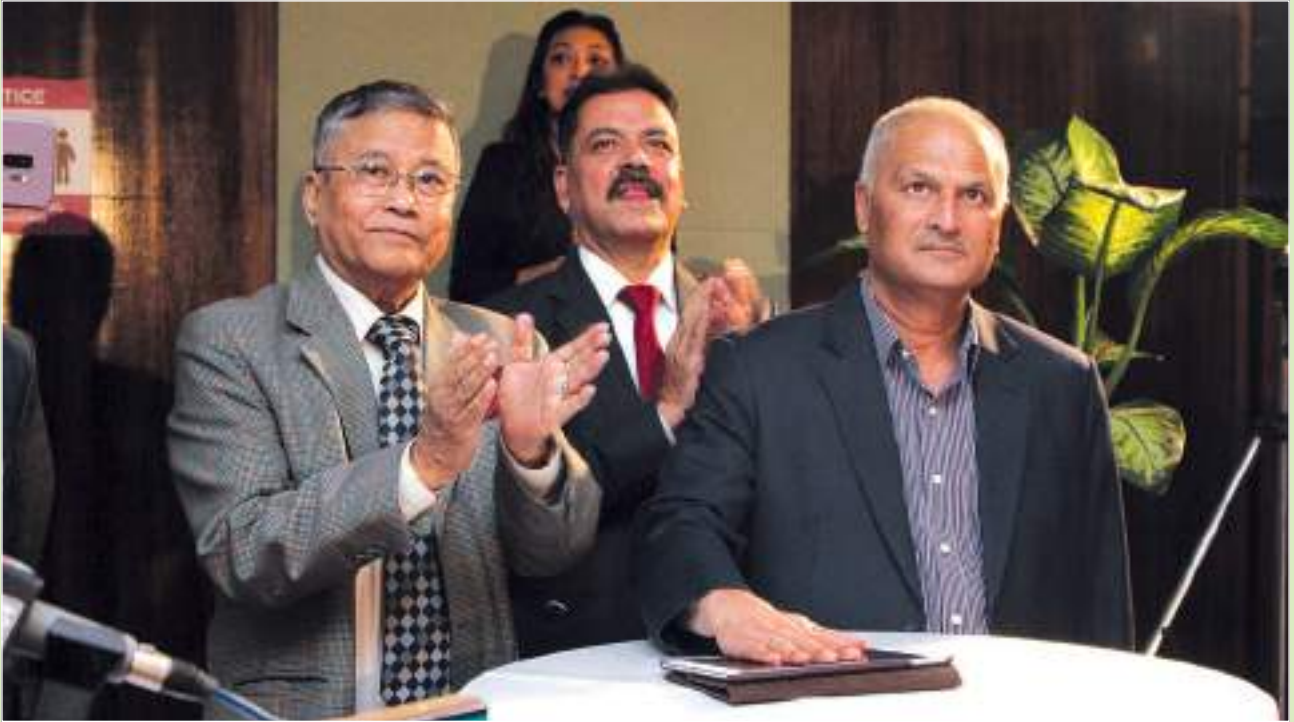
The inauguration of the Arogya Policy by the Chairman of Beema Samiti and Chairman of Sagarmatha Insurance.